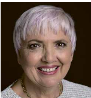
Claudia Roth (Staatsministerin für Kultur und Medien)

Kulturstaatsministerin Claudia Roth und die französische Kulturministerin Roselyne Bachelot-Narquin überreichen den Franz-Hessel-Preis am 24. März 2022 bei einer hybriden Preisverleihung in der Stiftung Genshagen.