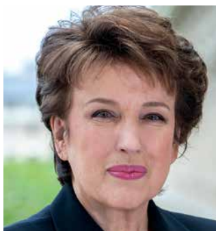
Roselyne Bachelot-Narquin (Französische Kulturministerin)